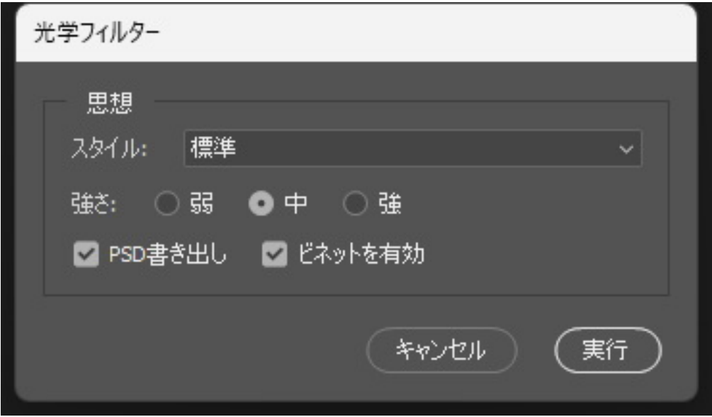
メイン操作ダイアログ

SideKick_Portrait.jsxbin をダブルクリックすると「Sidekick Portrait」ダイアログが開きます。スタイルと強さを選び「実行」を押すだけです。